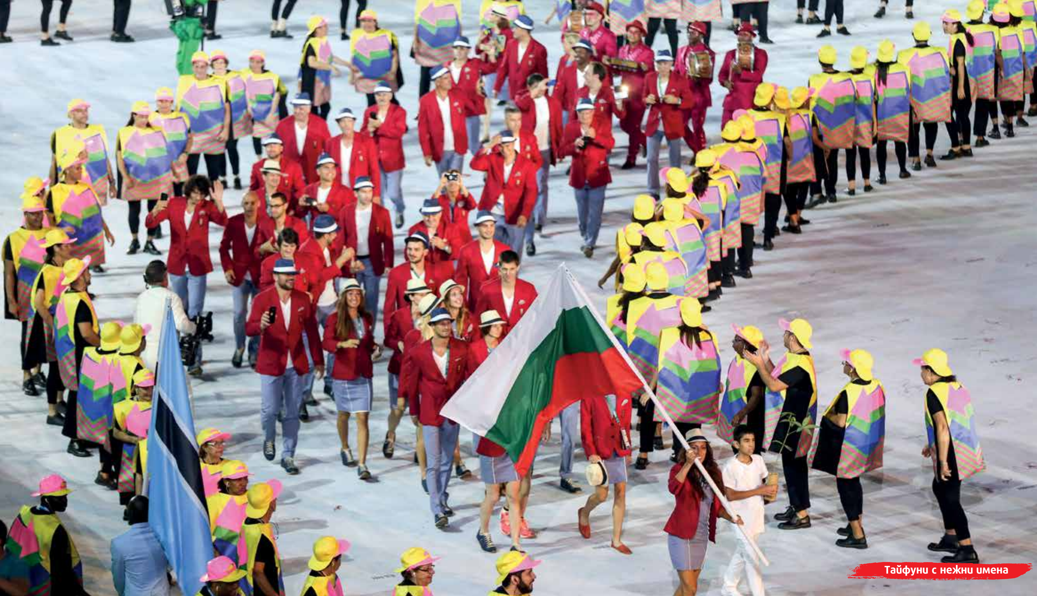
Тајфуну с нежни имена